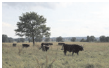
Jungstier Sando mit den Kalbinnen

Um Inzucht zu vermeiden, wurde die HECKRINDER-HERDE im Juni getrennt. Die Gruppe mit Stier Baron kam auf die Nord-Ostweide an der Klingsmooser Straße, die kleinere Gruppe mit Jungstier Sando blieb auf der süd-westlichen Fläche.